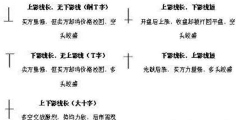
十字线（开盘等于收盘）